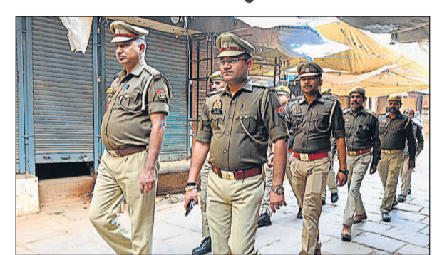
शुक्रवार को दालमंडी की बंद दुकानें और सुरक्षा के मद्देनजर गश्त करते पुलिसकर्मी।

ज्ञानवापी पर सुबह 10 बजे से ही फोर्स लगा दी गई थी। पुलिस, पीएसी, आरएफएफ, एटीएस कमांडो सुरक्षा में तैनात रहे। दोपहर की नमाज के लिए 12 बजे से नमाजी प्रवेश करते रहे। डेढ़ बजे तक ज्ञानवापी मस्जिद का परिसर बंद गया था। पीने दो बजे नमाज शुरू हुई और ढाई बजे खत्म हुई। सुरक्षा के बीच नमाजी निकले। उधर, दालमंडी, नई सड़क, मदनपुरा, बजरडोहा, सरैया, नंदेसर, लोहात आदि क्षेत्र में मस्जिदों, अन्य धार्मिक स्थलों के फोर्स तैनात रही। दालमंडी, नई सड़क समेत कई बाजार बंद रहे: छह दिसंबर के मद्देनजर दालमंडी, नई सड़क, हड़हासरपाय, लोहात में कुछ इलाकों में बाजार बंद रहे। इस दौरान पुलिस तैनात रही।