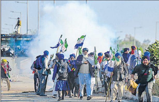
शंभू बॉर्डर से शुक्रवार को किसानों ने दिल्ली के लिए पैदल मार्च शुरू कर दिया। किसानों को रोकने के लिए सुरक्षाकर्मियों ने आंसू गैस का इस्तेमाल किया।

इसके बावजूद सतनाम वाहेगुरु का जाप करते हुए और किसान यूनियन के झंडे एवं आवश्यक वस्तुएं लेकर मार्च कर रहे जत्थे ने शुरुआती स्तर के अवरोधक आसानी से पार कर लिए,