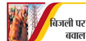
बिजली पर बवाल

वाराणसी, वरिष्ठ संवाददाता। बिजली विभाग के निजीकरण के विरोध में शनिवार को विरोध सभा होगी। पूर्वांचल-डिस्कॉम प्रबंधन ने भी इसपर पैनी नजर रखने की पूरी तैयारी की है। विद्युत कर्मचारी संयुक्त संघर्ष समिति के आह्वान पर आयोजित कार्यक्रम में शामिल होने वाले अभियंताओं और कर्मचारियों को बूचकबंद किया गया है।