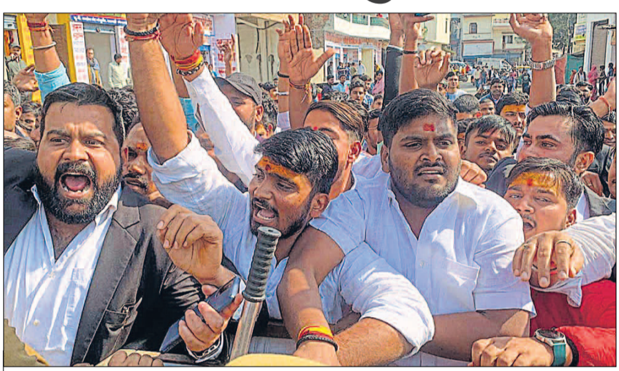
शुक्रवार को यूपी कॉलेज परिसर स्थित मस्जिद की ओर जा रहे छात्र नेताओं ने रोकने पर जमकर नारेबाजी की। • हिन्दुस्तान

वाराणसी, हिन्दुस्तान टीम। यूपी कॉलेज परिसर स्थित मजार और मस्जिद को लेकर चल रहे विरोध के बीच शुक्रवार को पूर्व छात्र ध्वजा लेकर हनुमान चालीसा पढ़ने परिसर की ओर बढ़े, जिन्हें गेट से 100 मीटर दूर रोक दिया गया। पुलिस और छात्रों के बीच आधे घंटे तक धक्कामुक्की चली। इसके बाद पुलिस ने लाटियां फटकारों। कॉलेज परिसर, गेट और आसपास फोर्स तैनात कर दी गई है।