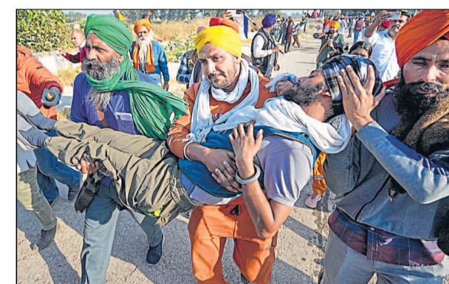
पंजाब-हरियाणा सीमा के शंभू बॉर्डर पर शुक्रवार को पुलिस से हुए टकराव के दौरान घायल प्रदर्शनकारी को लेकर जाते साथी।

शंभू (पंजाब), एजेंसी। पंजाब-हरियाणा सीमा के शंभू बॉर्डर से 101 किसानों के जत्थे ने शुक्रवार को दिल्ली के लिए पैदल मार्च शुरू किया, लेकिन उन्हें कुछ मीटर बाद ही बहुस्तरीय अवरोध लगाकर पुलिस ने रोक दिया। कुछ किसान आगे बढ़े तो सुरक्षाकर्मियों ने आंसू गैस का इस्तेमाल किया। किसान फसलों के लिए एमएसपी की कानूनी गारंटी की मांग को लेकर केंद्र पर दबाव बनाने को मार्च कर रहे हैं।