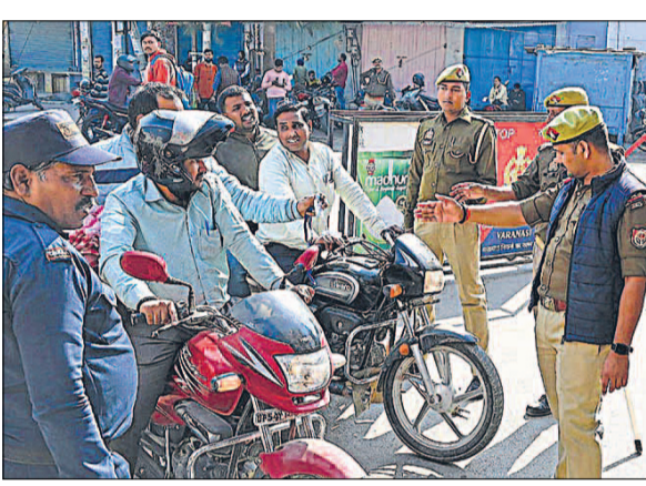
कॉलेज परिसर में प्रवेश से पूर्व वाहनों की सघन तलाशी ली गई। • हिन्दुस्तान

पुलिस ने छात्रों को गेट से अंदर नहीं जाने दिया। झड़प के बाद छात्र वापस हुए। भोजपुरी स्थित राजर्षि प्रतिमा के सामने हनुमान चालीसा का पाठ किया। बंद रहें दुकानें, दुकानदार रहे मायूस: प्रदर्शन के बाद यूपी कॉलेज गेट से भोजपुरी मुख्य मार्ग तक दोनों पटरियों की दुकानें बंद रही। दुकानदार खुद ही दुकानें बंद कर दिखे थे, वे मायूस भी थे। शांतिपूर्ण तरीके से चली परीक्षाएं: यूपी कॉलेज में शुक्रवार को विरोध के बीच अंदर परिसर में परीक्षाएं हुईं।