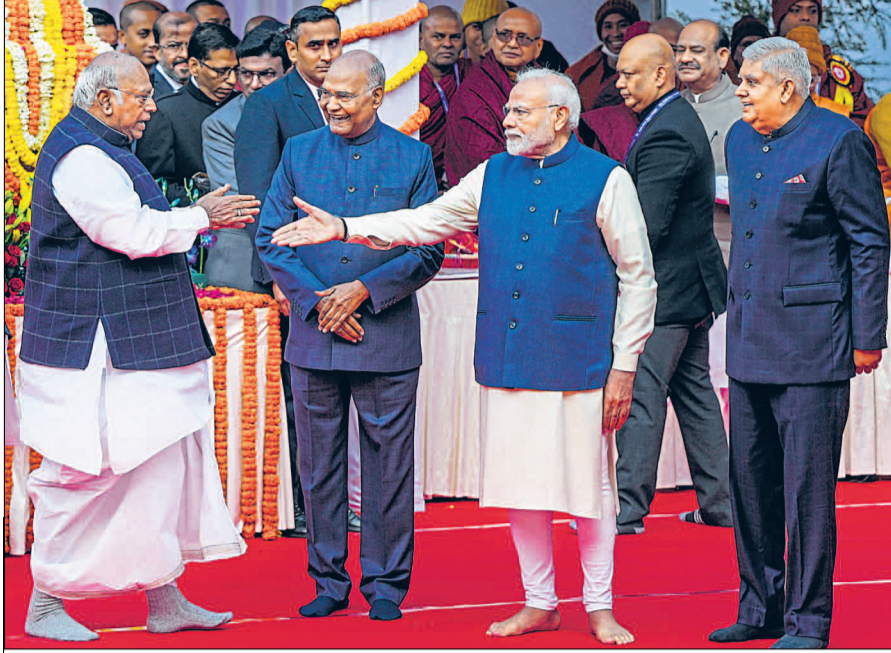
सविधान निर्माता डॉ. भीमराव आंबेडकर की पुण्यतिथि पर शुक्रवार को संसद परिसर में उन्हें श्रद्धांजलि दी गई। इसी दौरान प्रधानमंत्री नरेंद्र मोदी ने राज्यसभा में नेता प्रतिपक्ष और कांग्रेस के राष्ट्रीय अध्यक्ष मल्लिकार्जुन खरगे से गर्मजोशी से मुलाकात की। इस मौके पर उपराष्ट्रपति जगदीप धनखड़ और पूर्व राष्ट्रपति रामनाथ कोविंद भी मौजूद रहे। •प्र

नई दिल्ली, एजेंसी। प्रधानमंत्री नरेंद्र मोदी ने शुक्रवार को कहा कि लंबे समय तक पूर्वोत्तर क्षेत्र को वोटों की संख्या से तौलना गलत है। हालांकि, जब से केंद्र में एनडीए की सरकार बनी है, तब से उन्होंने दिल्ली और दिल से दूरी के भाव को कम करने का भरसक प्रयास किया है। उन्होंने कहा कि आने वाला समय पूर्वी भारत और पूर्वोत्तर का होगा। राष्ट्रीय राजधानी स्थित भारत मंडपम में तीन दिवसीय अष्टलक्ष्मी महोत्सव का उद्घाटन करते हुए प्रधानमंत्री ने यह भी कहा कि पूर्वोत्तर के आठ राज्यों, असम, अरुणाचल प्रदेश, मणिपुर, मेघालय, मिजोरम, नगालैंड, त्रिपुरा और सिक्किम में अष्टलक्ष्मी के दर्शन होते हैं। साथ ही उन्होंने विश्वास जताया कि आने वाला समय पूर्वी भारत और पूर्वोत्तर का होगा। प्रधानमंत्री ने अष्टलक्ष्मी के आठ रूपों की तुलना पूर्वोत्तर के राज्यों की अलग-अलग विशेषताओं से करते हुए कहा कि आज पूर्वोत्तर में निवेश के लिए बहुत उत्साह है। उन्होंने कहा, बीते एक दशक में पूर्वोत्तर क्षेत्र के विकास की अद्भुत यात्रा रही है। केंद्र के मंत्री 700 से अधिक बार पूर्वोत्तर के राज्यों में गए हैं। पूर्व पीएम वाजपेयी के कार्यकाल में पूर्वोत्तर क्षेत्र के विकास के लिए अलग मंत्रालय गठित किए जाने का उल्लेख करते हुए उन्होंने कहा, बीते दशक में हमने भरसक प्रयास किया कि दिल्ली और दिल, इससे दूरी का जो भाव है, वो कम होना चाहिए। उन्होंने अष्टलक्ष्मी के आयोजन को पूर्वोत्तर के बेहतरीन भविष्य का उत्सव करार देते हुए कहा कि यह विकास के नूतन सूर्योदय का भी उत्सव है।