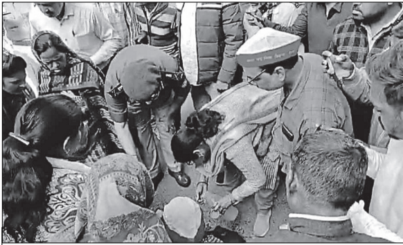
गंश खाकर गिरी लेखपाल की मां के चेहरे पर पानी छिड़कती महिला।