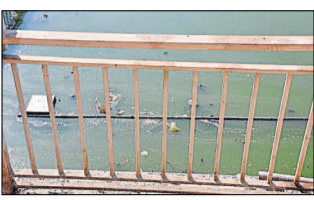
दुर्गाकुंड में फैली गंदगी।

स्वयं एक बार उनसे मुलाकात कर लूं। देखूं आखिर क्या कहते हैं हमारे महापौर। मैं उनसे मिलने निकलने ही वाला था कि पहले तो मुख्यमार्ग के जबरदस्त जाम ने रास्ता रोक लिया। उसी जाम में फंसे दुर्ग विनायक मंदिर के प्रबंधक को यह कहते सुना कि